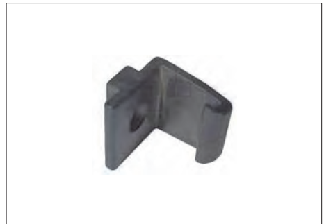
ASR-10 ΑΓΚΙΣΤΡΟ ΜΟΝΟΦΥΛΛΗΣ ΣΗΤΑΣ ΟΡΙΖΟΝΤΙΑΣ ΚΙΝΗΣΗΣ (18 τμχ.) HOOK FOR SINGLE HORIZONTAL SYSTEM (18 items)