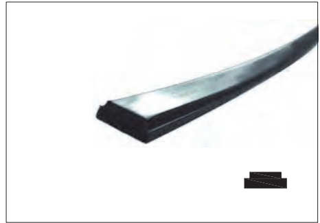
ASR-21 ΜΑΓΝΗΤΗΣ MAGNETIC BAND