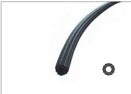
ASR-26 ΚΟΡΔΟΝΙ ΣΗΤΑΣ PLIABLE PVC ROD