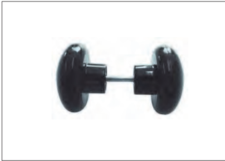
ASR-22 ΠΟΜΟΛΟ KNOB