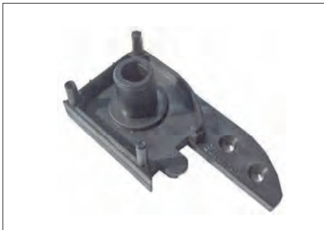
ASR-2 ΤΑΠΑ ΚΟΥΤΙΟΥ ΑΠΛΗ (30 τμχ.) END CAP (30 items)