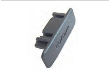
ASR-6 ΤΑΠΑ ΚΑΤΩΚΑΣΙΟΥ ΚΑΘΕΤΗΣ ΚΙΝΗΣΗΣ (60 τμχ.) SLIDING BAR END FOR VERTICAL SYSTEM (60 items)