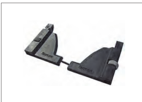
ASR-7 ΣΤΟΠΕΡ ΚΑΤΩΚΑΣΙΟΥ ΚΑΘΕΤΗΣ ΚΙΝΗΣΗΣ (30 ζεύγη.) LOCK FOR VERTICAL SYSTEM (30 pairs)