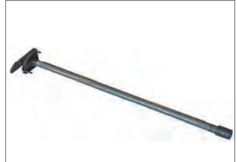
ASR-44 ΜΗΧΑΝΙΣΜΟΣ ΕΛΑΤΗΡΙΟΥ (μεγάλος) (30 τμχ.) LARGE END CAP WITH SPRING (30 items)