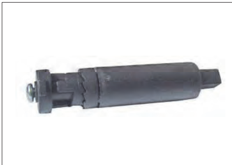
ASR-28 ΦΡΕΝΟ ΣΗΤΑΣ BREAK FOR INSECT SCREEN