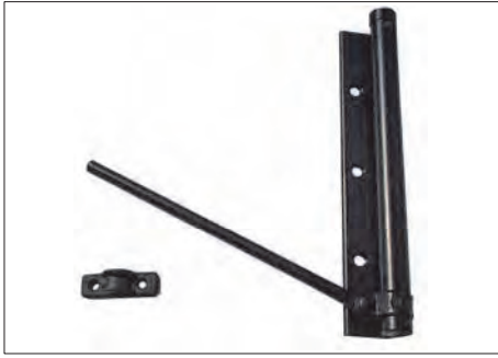
ASR-25 ΜΗΧΑΝΙΣΜΟΣ ΕΠΑΝΑΦΟΡΑΣ ΠΟΡΤΑΣ RETURN SPRING FOR DOOR