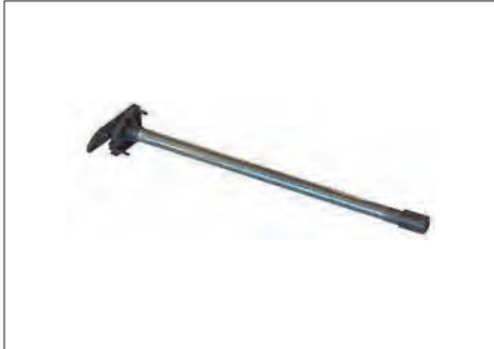
ASR-32 ΜΗΧΑΝΙΣΜΟΣ ΕΛΑΤΗΡΙΟΥ (μικρός) (30 τμχ.) SMALL END CAP WITH SPRING (30 items)