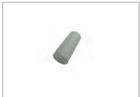
ASR-12 ΠΑΡΑΤΗΡΗΤΗΣ (30 τμχ.) OBSERVER (30 items)