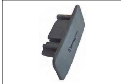
ASR-9 ΤΑΠΑ ΚΑΤΩΚΑΣΙΟΥ ΟΡΙΖΟΝΤΙΑΣ ΚΙΝΗΣΗΣ (60 τμχ.) SLIDING BAR END FOR HORIZONTAL SYSTEM (60 items)