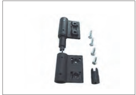
ASR-24 ΜΕΝΤΕΣΕΣ ΕΠΑΝΑΦΟΡΑΣ ΜΕ ΕΛΑΤΗΡΙΟ NYLON HINGE WITH RETURN SPRING