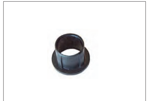
ASR-3 ΑΝΤΑΠΤΩΡΑΣ ΑΞΟΝΑ (30 τμχ.) ADAPTER RING FOR AXIS (30 items)