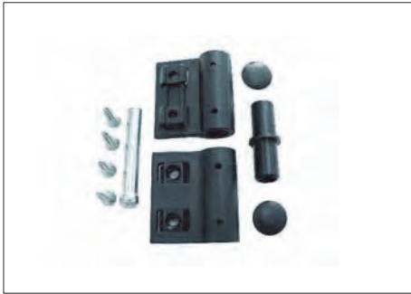
ASR-23 ΜΕΝΤΕΣΕΣ ΑΠΛΟΣ SIMPLE NYLON HINGE