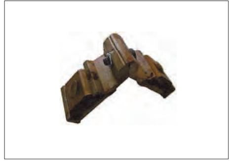
ASR-20 ΓΩΝΙΑ ΣΥΝΔΕΣΕΩΣ ΚΑΣΑΣ-ΦΥΛΛΟΥ CORNER JOINT FOR FRAME-SASH