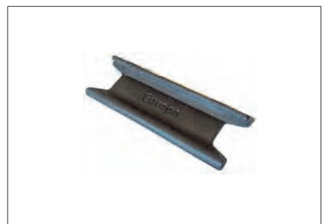
ASR-5 ΛΑΒΗ ΚΑΤΩΚΑΣΙΟΥ (60 τμχ.) HANDLE (60 items)